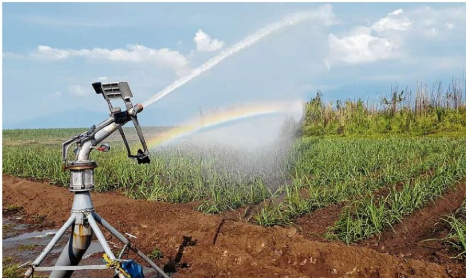
Infraestructura. La implementación de sistemas especializados de riego para el cultivo de la caña de azúcar en el departamento del Valle del Cauca ha redundado en un menor consumo de líquido por parte de esta industria.