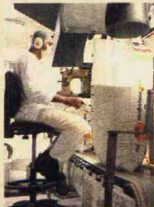
Producción de azúcar.

El SAFF opera de forma asimétrica, porque