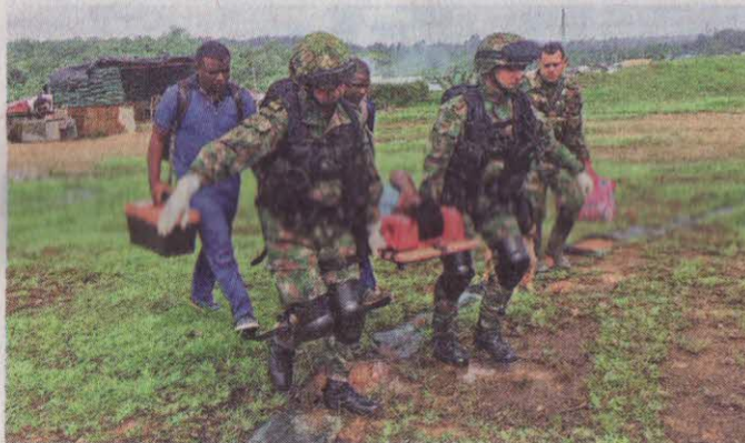
Las dos embarazadas fueron trasladadas desde Magüi Payán a Tumaco, en Nariño, donde nacieron sus hijos.

fuerzos por estas cuatro vidas”. Los enfermeros de combate de la unidad militar