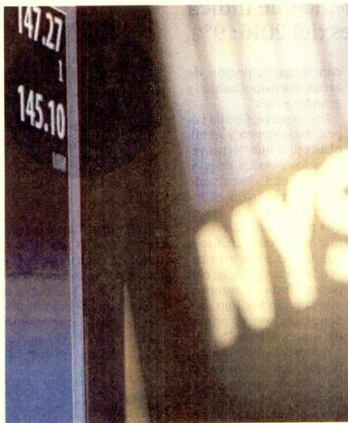
Ecopetrol presentó el 20-F a la SEC y la NYSE.

Además de ya no aplicarse los procedimientos establecidos en la Sección 802.01E del Manual de Compañías listadas en la Bolsa de Nueva York, la petrolera colombiana podrá emitir valores dentro del mercado americano, como